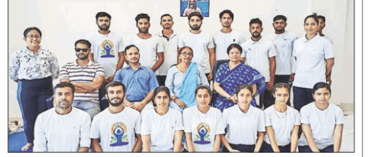
विशेषज्ञ व्याख्यान के बाद प्रतिभागी विद्यार्थी विशेषज्ञ एवं शिक्षकों के साथ।